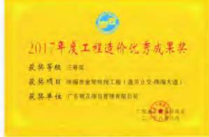
(2017年度工程造价优秀成果奖(三等奖))

3. 由我司负责造价服务的“珠海市金湾铁线工程（渣贝立交-珠海大道）”项目，服务质量得以肯定，获得业主及建设主管单位的满意评价。经广东省工程造价协会的评定，认为该项目所采用的主要技术具有较好的前瞻性。研究水平，有创新，方法正确，咨询、研究成果对行业发展有一定影响，在省内具有应用性和可操作性，达到行业先进水平。依据广东省工程造价协会成果评优办法，评选为“2017年度工程造价优秀成果奖三等奖”。