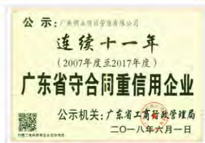
(广东省守合同重信用企业)

4. 明正公司自成立以来，恪守“诚信履约、守法经营”的宗旨，重视合同的管理和企业信用的建设。在合同管理制度、履约能力以及企业社会信誉等方面所取得的成绩获得广东省工商行政管理局的充分肯定，在2007年度至2017年度连续十一年被广东省工商行政管理局评选为“广东省守合同重信用企业”。