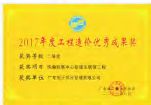
(2017年度工程造价优秀成果奖(二等奖))

2. 由我司负责造价服务的“珠海航展中心新建主展馆工程”项目，服务质量得以肯定，获得业主及建设主管单位的一致好评。经广东省工程造价协会的评定，认为该项目主要技术具有较高级别的咨询水平和一定的研究价值，有一定的创新性；社会和经济效益较好，对行业发展有较大影响，具有可操作性，应用范围较广，在国内或省内同期同类成果中处于先进水平。依据广东省工程造价协会成果评优办法，评选为“2017年度工程造价优秀成果奖二等奖”。